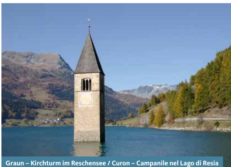
Graun - Kirchturm im Reschensee / Curo - Campanile nel Lago di Resia