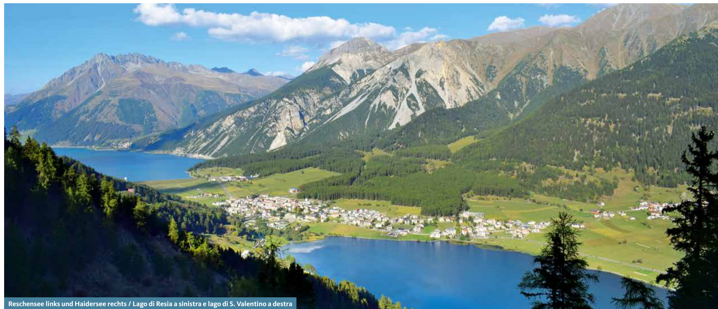
Reschensee links und Haidersee rechts / Lago di Resia a sinistra e lago di S. Valentino a destra