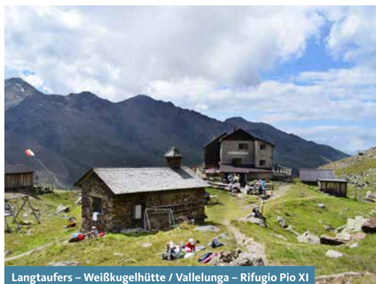
Langtauferer - Weißkugelhütte / Vallelunga - Rifugio Pio XI