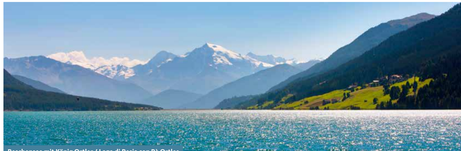
Reschensee mit König Ortler / Lago di Resia con Re Ortles