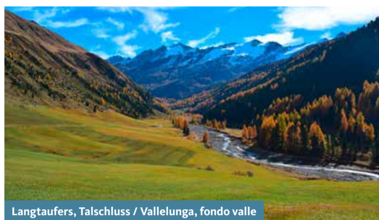
Langtauferer, Talschluss / Vallelunga, fondo valle