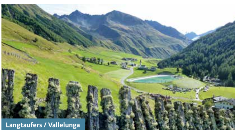
Langtauferer / Vallelunga