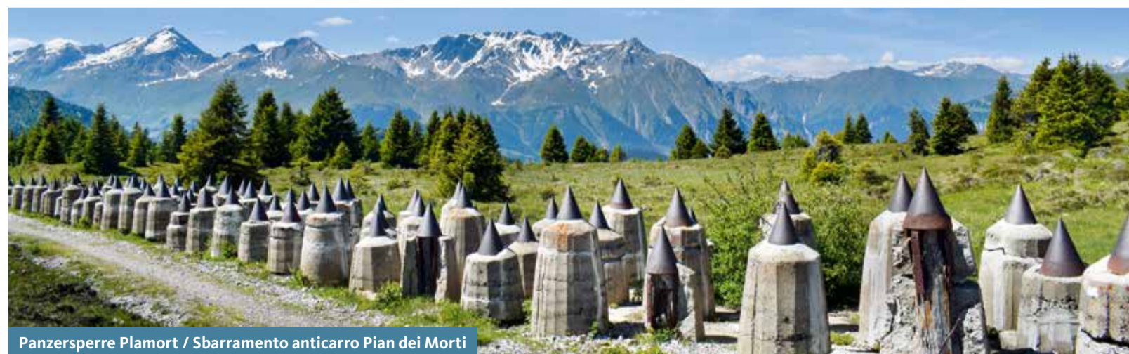
Panzersperre Plamort / Sbrammento anticarico Plan dei Morti